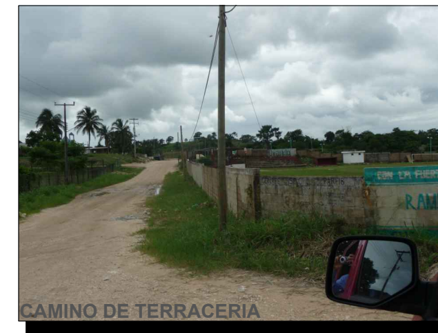
CAMINO DE TERRACERIA