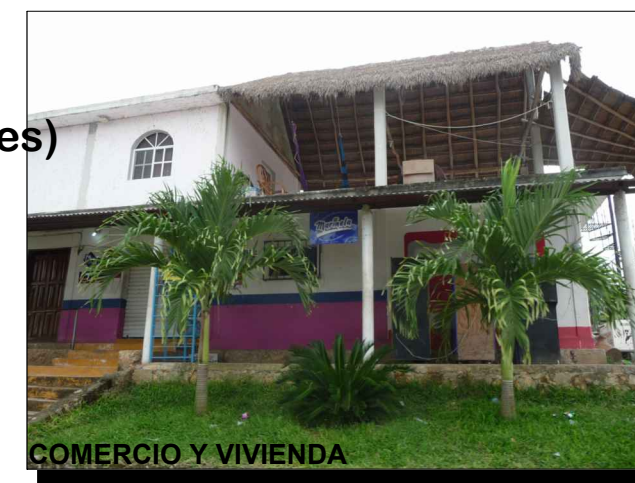
COMERCIO Y VIVIENDA