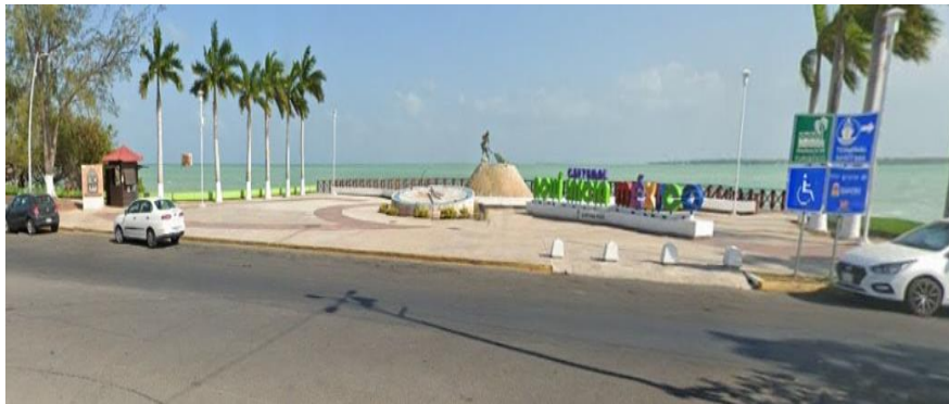
Módulo de información turística: Fuente del Pescador