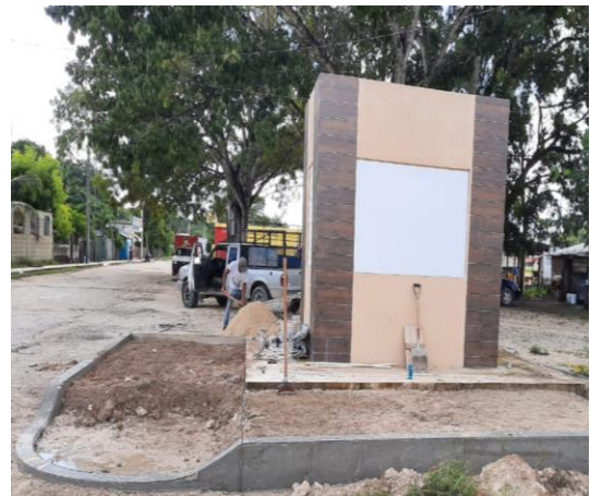
Módulo de información turística: Xul-Ha.