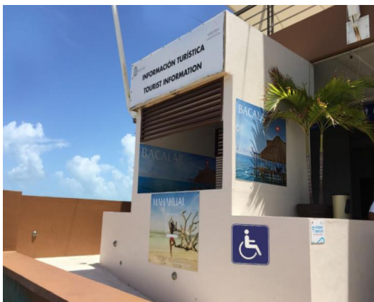
Módulo de información turística: Terminal marítima "Nachicom".