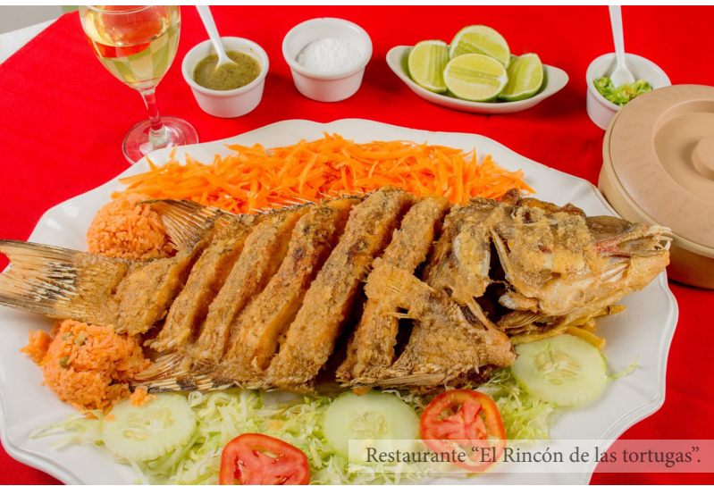
Restaurante "El Rincón de las tortugas".

No puedes dejar de probar, el platillo endémico de Calderitas único en la región, "El Pescado al Pil-Pil". Ven y hospédate en uno de sus hoteles y cabañas que se encuentra a la orilla la bahía, o bien acampar en su trailer park, convirtiéndose en el lugar idóneo para disfrutar en familia de los amaneceres y atardeceres majestuosos que solo se viven en el sur de Quintana Roo.