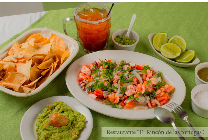
Restaurante "El Rincón de las tortugas".

No olvides preguntar en cualquier restaurante de calderitas sobre los paseos en lancha a estos majestuosos lugares.