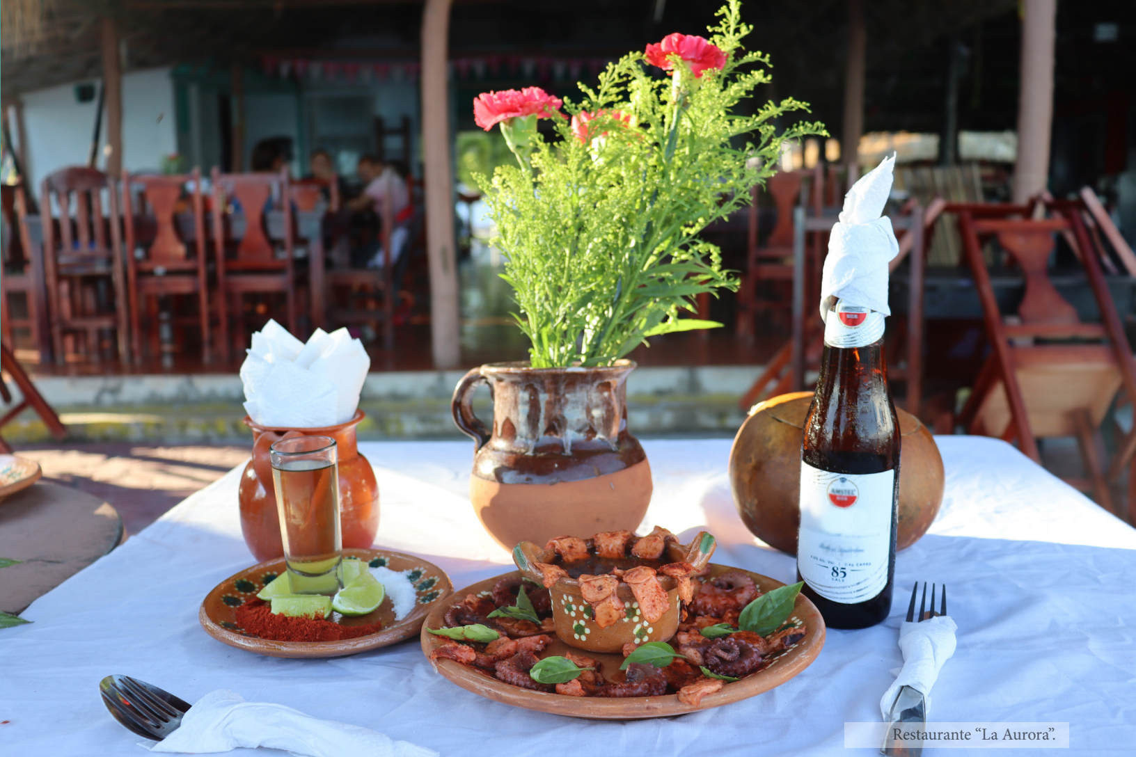
Restaurante "La Aurora".