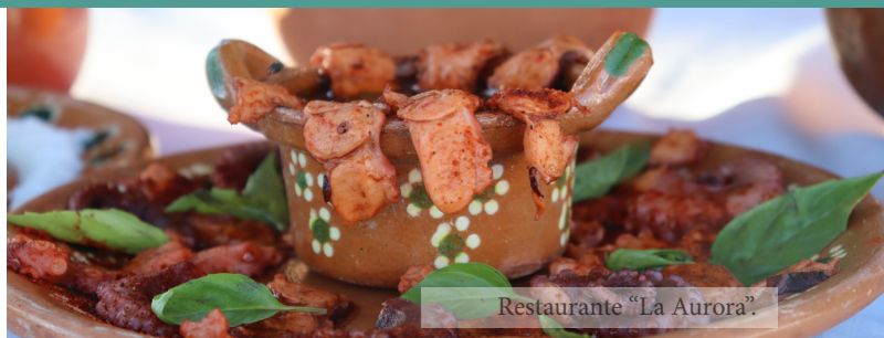
Restaurante "La Aurora".