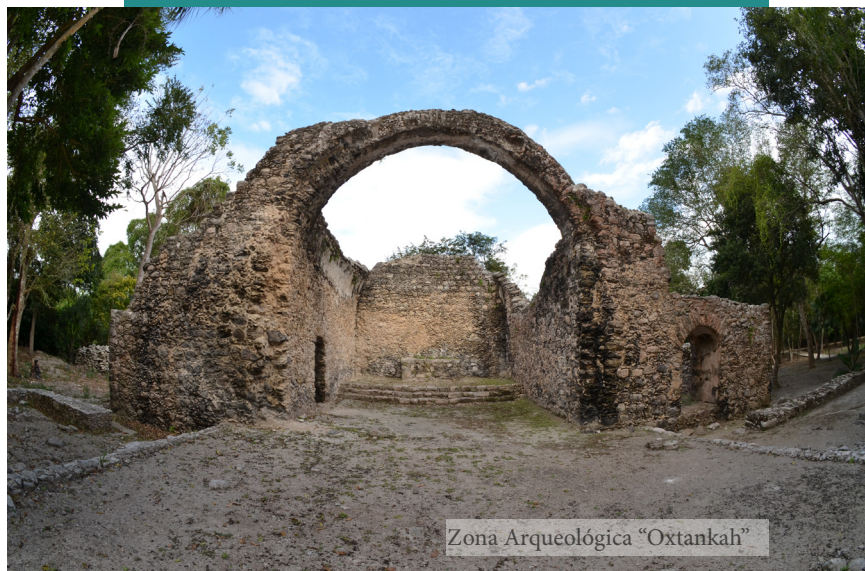
Zona Arqueológica "Oxtankah"

Uno de los puntos más destacados de calderitas es su cercanía a la zona arqueológica de Oxtankah, la ciudad prehispánica más grande e importante descubierta en la bahía de Chetumal, se distingue por ser la única que cuenta con una capilla cristiana que data en tiempos de la conquista española, se dice que aquí se originó el primer mestizaje.