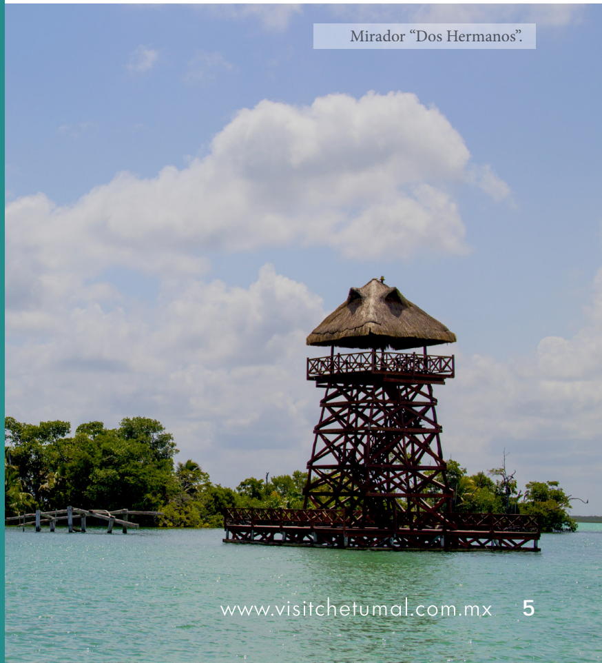
Mirador "Dos Hermanos".