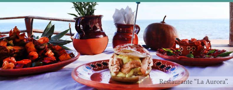
Restaurante "La Aurora".