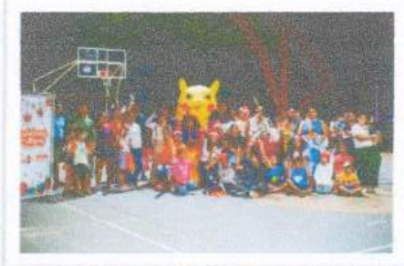
Colonia Americas II