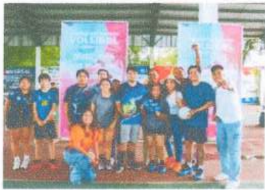
Entrega de material deportivo para el torneo relámpago de las juventudes OPB

En nuestra estrategia de Convivencia en la Paz, durante este trimestre seguimos apostándole al deporte para reforzar y reconstruir el tejido social con nuestro Programa “Deporte para Tod@s”. A través de este programa llegamos a las comunidades y a las colonias, con material deportivo, uniformes, apoyos económicos, así como premiaciones para los diversos torneos en los que somos invitadas. De esta manera, en esta ocasión se brindó acompañamiento al Torneo Relámpago de Juventudes OPB, así como al equipo de béisbol de Carlos A. Madrazo en sus actividades deportivas. Asimismo, se realizó la entrega de balones de voleibol al equipo Cuervos, la donación de uniformes al equipo Santos de Butrón, y se apoyó económicamente al equipo de softbol Guerreros. Asimismo, en aportaciones en premios diversos, se participó en la final del torneo de futbol de la zona elotera en Nuevo Becar, así como en la final de futbol rápido en San Pedro peralta. Al mismo tiempo, visitamos los equipos de softbol de Dos Aguadas, de béisbol de San Antonio Sosa, al equipo de volibol Lechuzas de Chetumal, al equipo valkirias de softbol de Calderitas, al equipo de futbol femenino de Tesoro, al equipo de futbol de la Colonia Flamings y al torneo de volibol de Bacalar. Estas acciones refrendan el compromiso de impulsar el deporte como una herramienta de integración social, bienestar y desarrollo comunitario.