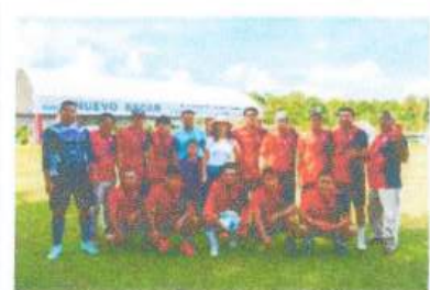
Apoyo en premiación en la Final del Torneo de Futbol de la Zona Zacatera y Elotera en Nuevo Becar