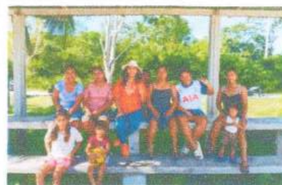
Entrega de material deportivo al equipo de futbol femenino de Tesoro.