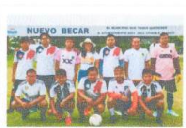
Semifinal del Torneo de Futbol de la Zona Zacatera y Elotera en Nuevo Becar