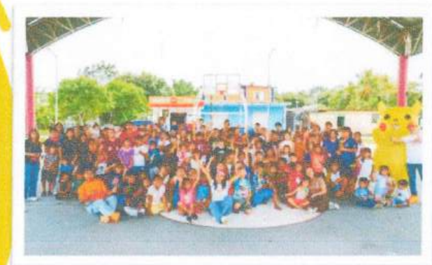
Comunidad de Huay-Pix