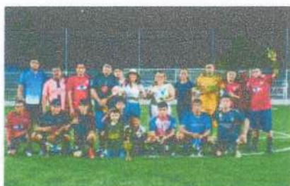
Apoyo en premiación en la Final del Torneo de Futbol Rápido en la Zona Elotera en la Comunidad de San Pedro Peralta