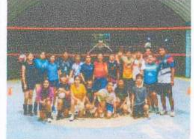
Visita al equipo de Volibol Lechuzas en la Colonia Forjadores