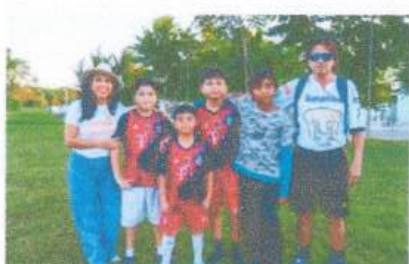
Apoyo económico para uniformes a equipo de Futbol de la Colonia Flamingos