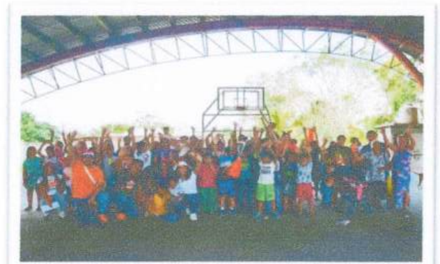
Comunidad de Ucum