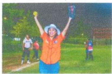
Visita el Equipo de Softbol Valkirias en su encuentro amistoso por la celebración de Halloween.