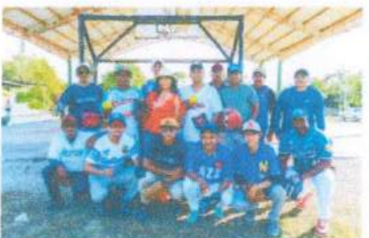
Entrega de Material Deportivo a equipo de softbol de Dos Aguadas