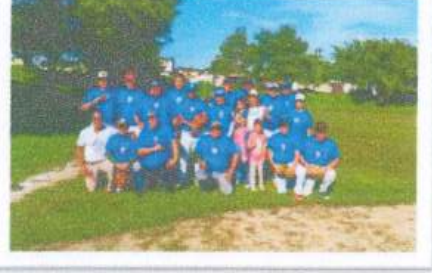
Visita al equipo de softbol Los Guerreros de Chetumal y entrega de apoyo económico para uniformes.