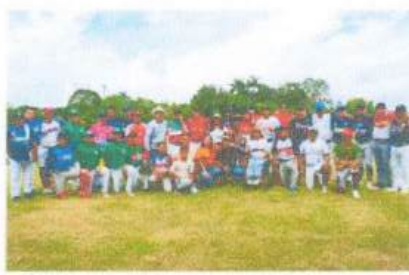
Visita al equipo de Béisbol de Carlos A. Madrazo, y apoyo económico para infraestructura.