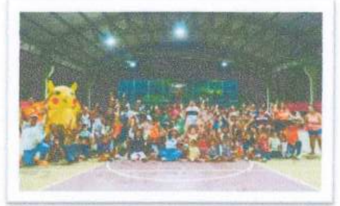
Colonia Pacto Obrero