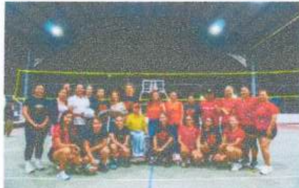
Participación en torneo de volibol de Bacalar.