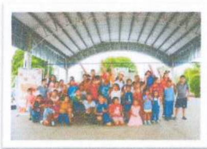
Comunidad de Gonzales Ortega

Durante estas fechas se realizaron visitas a las comunidades de Ucúm y Huay-Pix, así como a la colonia Pacto Obrero, colonia Américas II y el poblado de González Ortega, donde se contó con la participación activa de las y los habitantes. Estas acciones permitieron acercar la celebración de la Navidad a diversas zonas del municipio, contribuyendo a la convivencia intergeneracional y reafirmando el compromiso social de llevar actividades que fortalezcan el tejido comunitario y generen entornos de alegría, esperanza y unión para todas y todos.