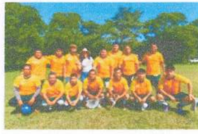
Entrega de uniformes deportivo para el equipo de Santos de Butron