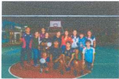
Entrega de material deportivo para el equipo volibol de cuervos