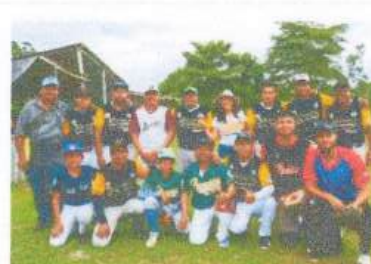
Visita al equipo de Béisbol de San Antonio Soda