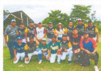
Visita al equipo de Béisbol de San Antonio Soda