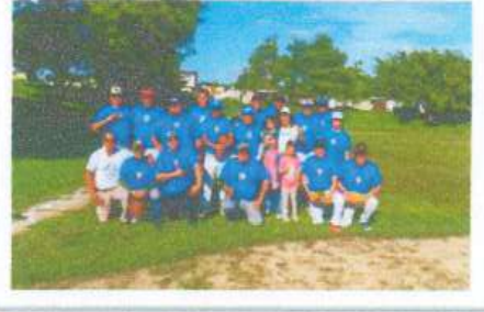
Visita al equipo de softbol Los Guerreros de Chetumal y entrega de apoyo económico para uniformes.