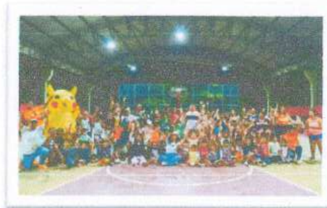
Colonia Pacto Obrero