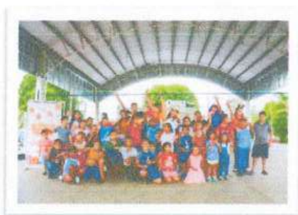
Comunidad de Gonzales Ortega

Durante estas fechas se realizaron visitas a las comunidades de Ucúm y Huay-Pix, así como a la colonia Pacto Obrero, colonia Américas II y el poblado de González Ortega, donde se contó con la participación activa de las y los habitantes. Estas acciones permitieron acercar la celebración de la Navidad a diversas zonas del municipio, contribuyendo a la convivencia intergeneracional y reafirmando el compromiso social de llevar actividades que fortalezcan el tejido comunitario y generen entornos de alegría, esperanza y unión para todas y todos.