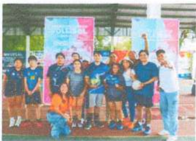
Entrega de material deportivo para el torneo relámpago de las juventudes OPB

En nuestra estrategia de Convivencia en la Paz e Igualdad Sustantiva, durante este trimestre seguimos apostándole al deporte para reforzar y reconstruir el tejido social con nuestro Programa "Deporte para Tod@s". A través de este programa llegamos a las comunidades y a las colonias, con material deportivo, uniformes, apoyos económicos, así como premiaciones para los diversos torneos en los que somos invitadas. De esta manera, en esta ocasión se brindó acompañamiento al Torneo Relámpago de Juventudes OPB, así como al equipo de béisbol de Carlos A. Madrazo en sus actividades deportivas. Asimismo, se realizó la entrega de balones de voleibol al equipo Cuervos, la donación de uniformes al equipo Santos de Butrón, y se apoyó económicamente al equipo de softbol Guerreros. Asimismo, en aportaciones en premios diversos, se participó en la final del torneo de futbol de la zona elotera en Nuevo Becar, así como en la final de futbol rápido en San Pedro peralta. Al mismo tiempo, visitamos los equipos de softbol de Dos Aguadas, de béisbol de San Antonio Sosa, al equipo de volibol Lechuzas de Chetumal, al equipo valkirias de softbol de Calderitas, al equipo de futbol femenino de Tesoro, al equipo de futbol de la Colonia Flamingos y al torneo de volibol de Bacalar. Estas acciones refrendan el compromiso de impulsar el deporte como una herramienta de integración social, bienestar y desarrollo comunitario.