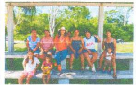
Entrega de material deportivo al equipo de futbol femenino de Tesoro.