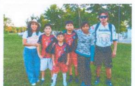
Apoyo económico para uniformes a equipo de Futbol de la Colonia Flamingos