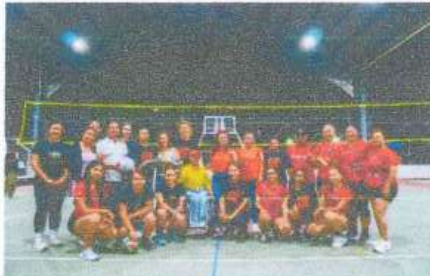
Participación en torneo de volibol de Bacalar.