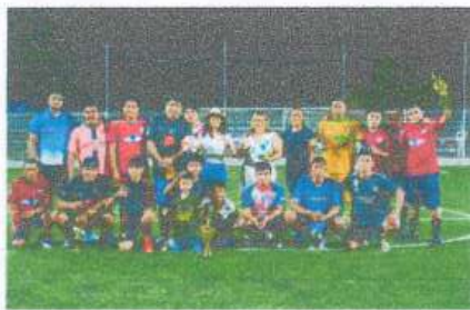
Apoyo en premiación en la Final del Torneo de Futbol Rápido en la Zona Elotera en la Comunidad de San Pedro Peralta