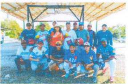
Entrega de Material Deportivo a equipo de softbol de Dos Aguadas