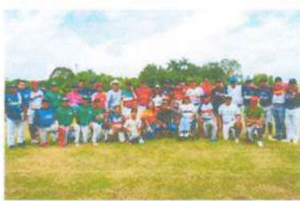
Visita al equipo de Béisbol de Carlos A. Madrazo, y apoyo económico para infraestructura.