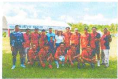
Apoyo en premiación en la Final del Torneo de Futbol de la Zona Zacatera y Elotera en Nuevo Becar