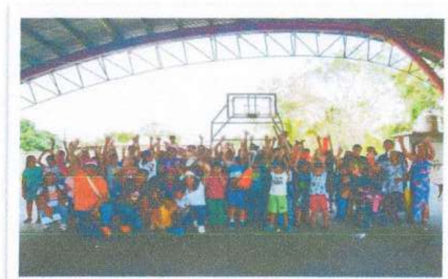
Comunidad de Ucum