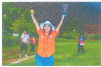
Visita el Equipo de Softbol Valkirias en su encuentro amistoso por la celebración de Halloween.