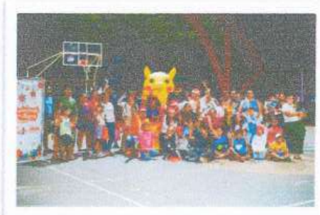
Colonia Americas II