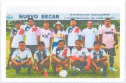
Semifinal del Torneo de Futbol de la Zona Zacatera y Elotera en Nuevo Becar