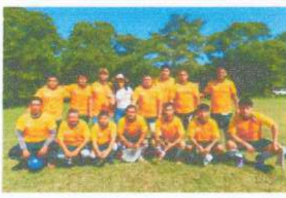
Entrega de uniformes deportivo para el equipo de Santos de Butron