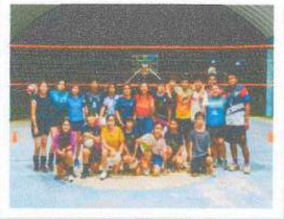
Visita al equipo de Volibol Lechuzas en la Colonia Forjadores