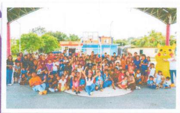
Comunidad de Huay-Pix