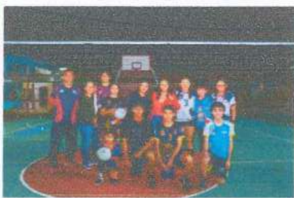
Entrega de material deportivo para el equipo volibol de cuervos