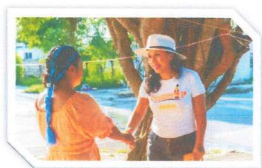
Recorrido en la colonia Arboledas