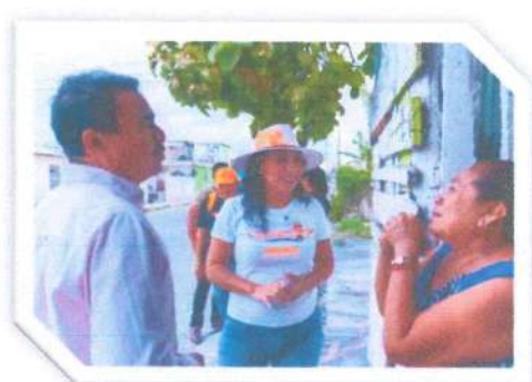
Recorrido en la colonia Proterritorio