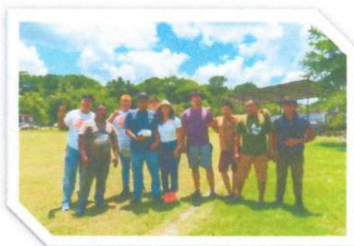
Apoyo de pelotas de béisbol para equipo de Caobas