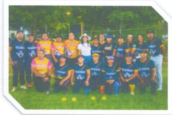
Reunión con Valkirias FC