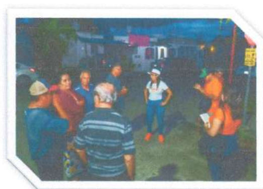
Junta vecinal en la colonia Sian Kaan