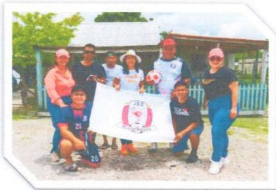
Apoyo de Balones de Futbol para equipo de González Ortega