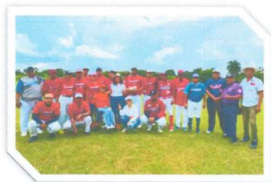
Play off y apoyo de pelotas de béisbol para equipo de Sabidos