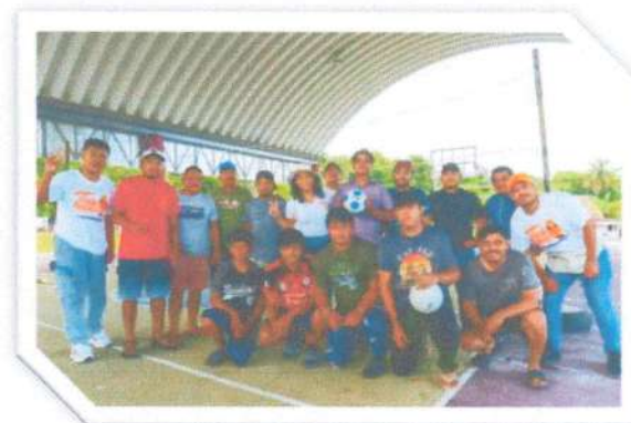
Entrega de Material Deportiva en Nuevo Becar