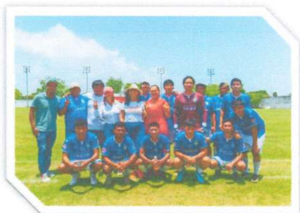
Participamos en la semifinal de la Liga de Primera Fuerza de Futbol de la Ribera del Río Hondo en Chetumal