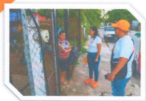
Recorrido en la colonia Centenario