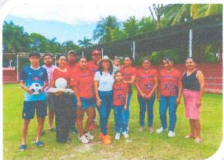
Entrega de balones de fútbol y volibol en Sac – Xan