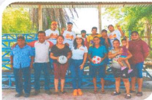
Entrega de balones de fútbol y vólibol en San Antonio Soda