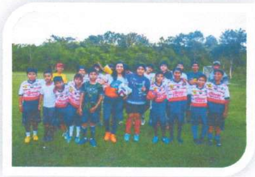
Entrega de balones de Futbol al equipo Halcones de San Pedro Peralta