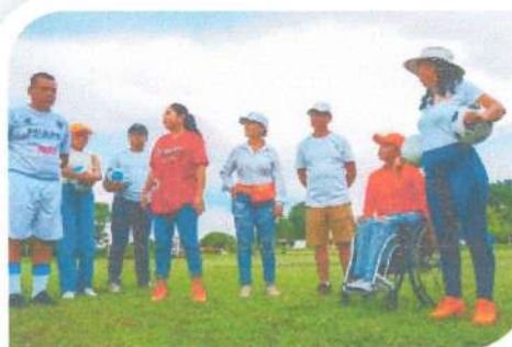
Entrega de balones de Fútbol al equipo de Ramonal