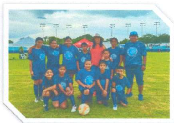
Reunión con Delfines FC de Chetumal