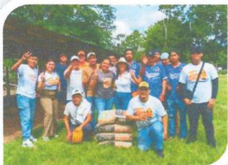
Entrega de bultos de cemento al equipo de béisbol de Rovirosa para sus baños en el campo

Asimismo, apoyamos el arranque de la Liga Independiente de Fútbol de Primera Fuerza de la Ribera del Río Hondo en Álvaro Obregón, y nos reunimos con diversos equipos deportivos como el equipo de softbol valquirias de Calderitas, Delfines FC de Chetumal.