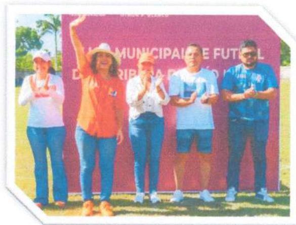
Participamos en la Final de la Liga de Primera Fuerza de Fútbol de la Ribera del Río Hondo en Álvaro Obregón