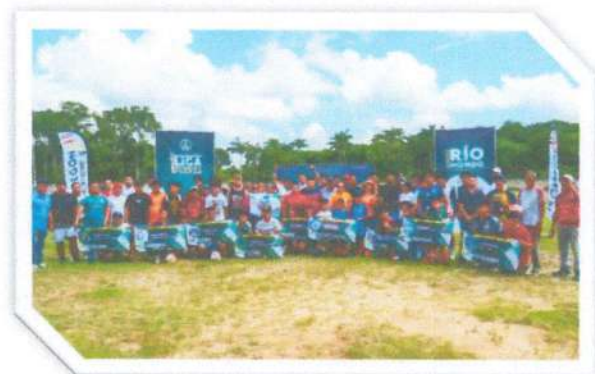
Inauguración de la Liga de Primera Fuerza de la Ribera del Río Hondo