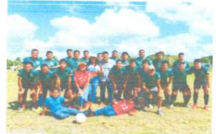
Partido Futbol en la Final sabidos