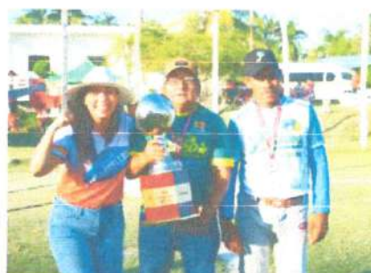
Final de Béisbol de la Liga de la Zona Limitrofe-Ribera del Río hondo