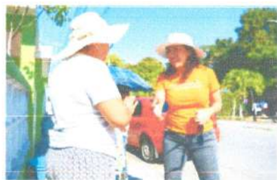
Recorrido en la colonia del Bosque