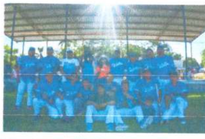
Partido de béisbol, potrillos de caobas