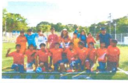
Entrega de uniformes san Pedro Peralta