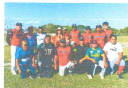
Partido de Béisbol de la Liga de la Zona Limitrofe en Nicolás bravo