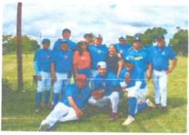
Partido de sóftbol en dos aguadas