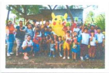
Colonia Nuevo progreso

Esta actividad tuvo como finalidad generar espacios de sana convivencia y alegría para las familias, fortaleciendo la cercanía con la ciudadanía y promoviendo acciones que contribuyan al bienestar e integración comunitaria.