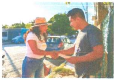
Recorrido en colonia Santa María