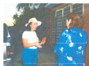
Recorrido en colonia Américas 1