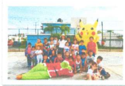
Colonia Guadalupe Victoria