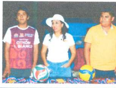
Liga de Voleibol Mixto-Ribera del Río Hondo