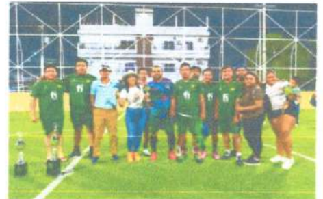
Final de Torneo Intertiendas