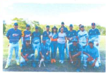
Partido de Béisbol en Cedral