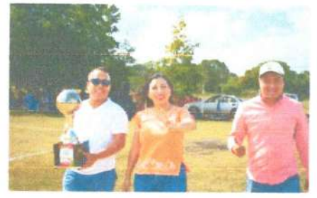
La Final de Primera Fuerza Cacao FC vs el Ingenio