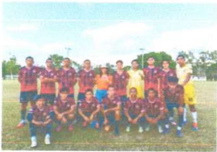
Encuentro de Futbol de Tercera División en la Ribera del Río Hondo