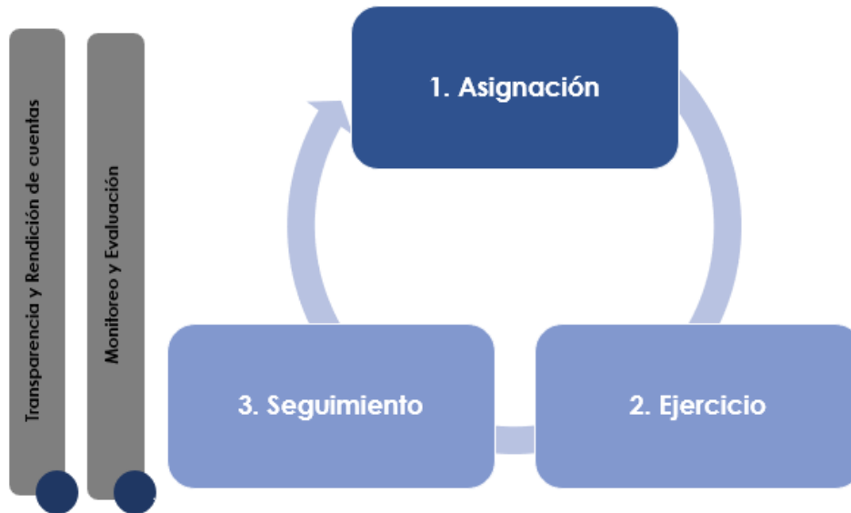
Tabla 7. Tabla general de procesos